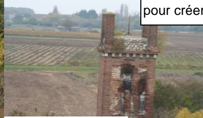
COMMUNE DE CINQ MARS LA PILE PILE DE CINQ MARS " Les Hauts de la Pile "