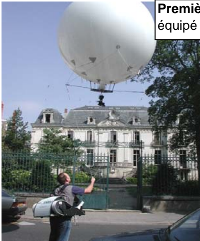
Première phase : prises de vues par ballon captif équipé d'un appareil photo radio commandé